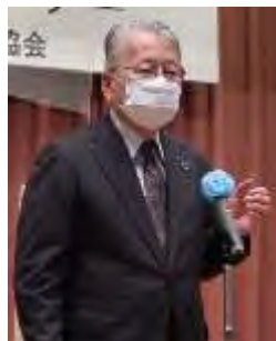
第1部 ピオトープ顕彰 表彰・講評・事例発表