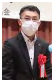
神奈川県・横浜市 ご祝辞