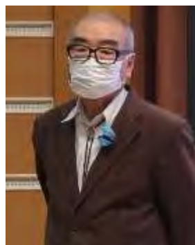
第2部 基調講演・特別講演